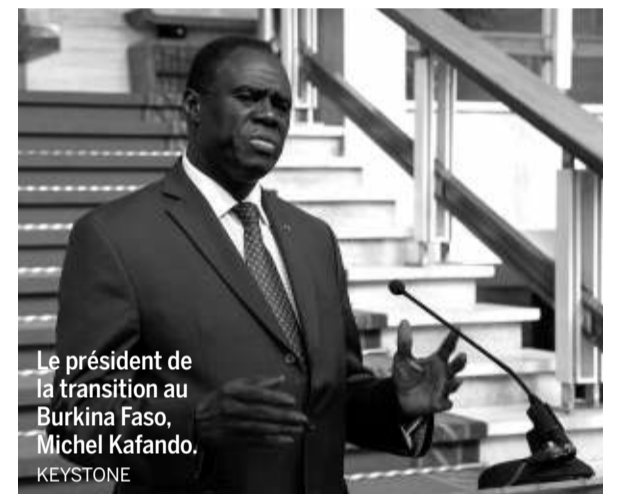
Le président de la transition au Burkina Faso, Michel Kafando.

13 BURKINA FASO Fin du coup d'Etat , le président réinvesti