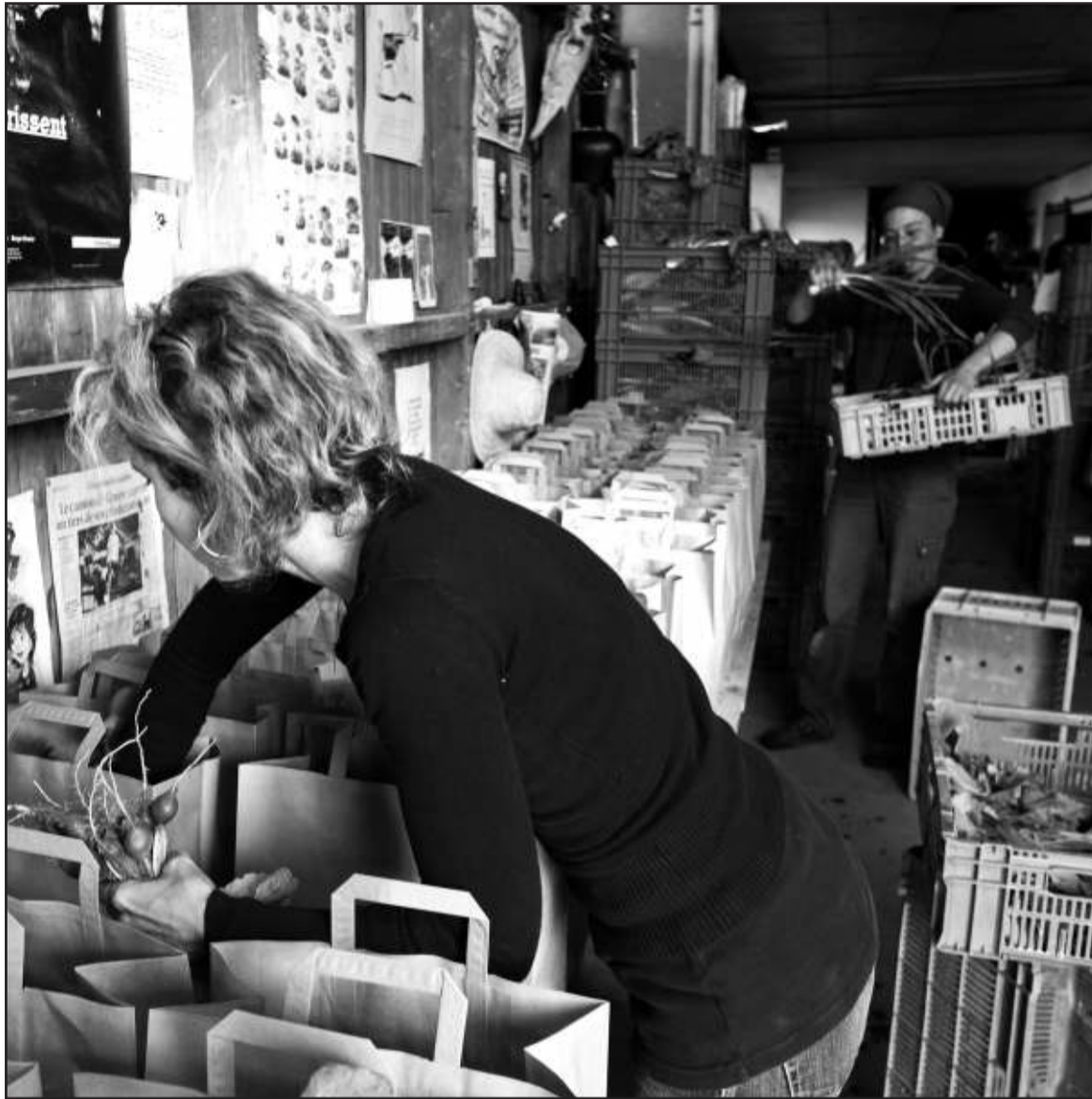
Plusieurs coopératives maraîchères sont présentes à Genève (ici les Jardins des Charrotons). Mais le projet des Vergers se montre plus ambitieux, puisque le supermarché participatif impliquera un quartier de 1250 ménages.